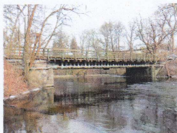
Stary most - lata 1920.